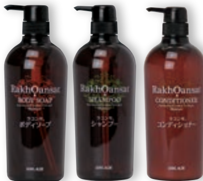
業務用アプリケータ 765mL