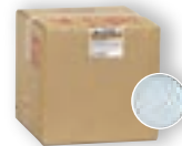
コンディショナー