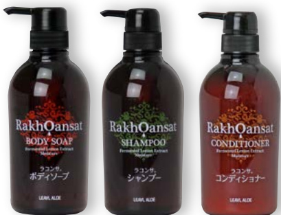
販売用 480mL・業務用アプリケータ 480mL