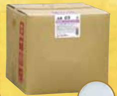
コンディショナー

掲載商品のデザイン・仕様の変更、及び生産の中止を予告なくすることがありますので、あらかじめご了承ください。 掲載商品の無断複製及び無断転載は固くお断りいたします。掲載商品写真はイメージです。実際とは若干異なります。